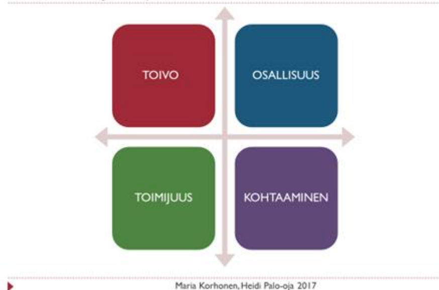
Kuvio 1. Toipumisen kulmakivet (Anthony 1993; Slade 2008; Falk&Kurki 2013; Nordling 2014)